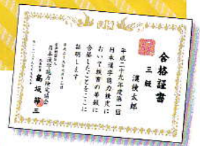
※画像はイメージです。お届けする賞状と異なる場合があります。